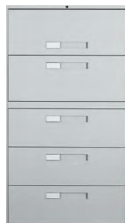
Gamme 9300 Plus