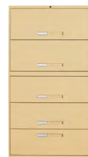
Gamme 9100 Plus